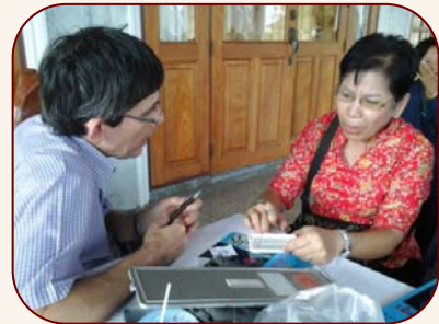
พบแพทย์ ปรึกษาปัญหาสุขภาพ