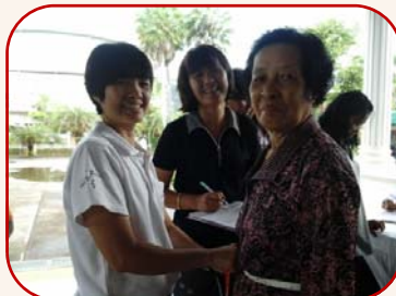
ประเมินปัจจัยเสี่ยงและโอกาสเกิดโรคหลอดเลือดหัวใจอุดตัน