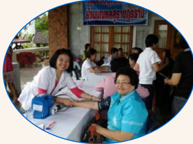
วัดความดันโลหิต